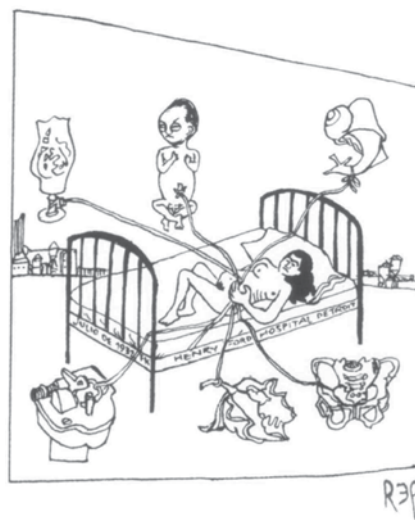
Rep, dibujo a partir de una obra de Frida Kahlo

1921 Diego Rivera regresa a México. 1924 André Breton publica el Primer Manifiesto Surrealista. Lenin muere y Stalin comienza a controlar la Unión Soviética. 1929 Cae la bolsa en Wall Street. Crisis económica mundial.