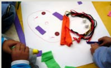
Taller del Programa de Visitas Participativas en Malba

Sugerimos estas actividades según los niveles escolares, pero dejamos abierta la posibilidad de que sean utilizadas en otros ámbitos de la educación no formal.