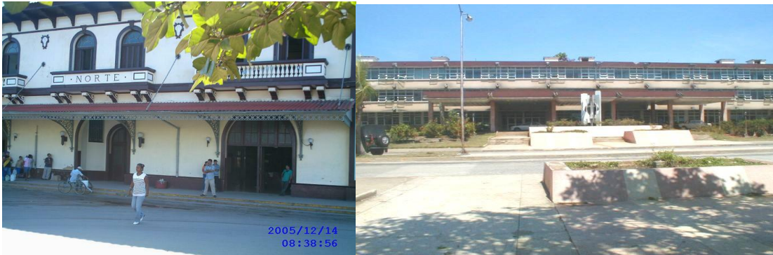
Estación de ferrocarriles y Hospital "Roberto Rodríguez" Morón. (Morón's station and Morón General Hospital).