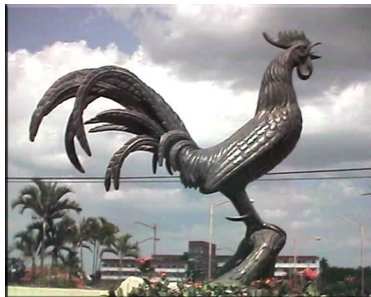
El Gallo de Morón, Símbolo Emblemático de la Ciudad.