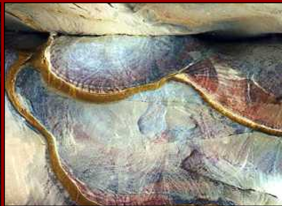
Es que la colorida composición geológica de la arena es propicia para "pinturas" naturales como estas.