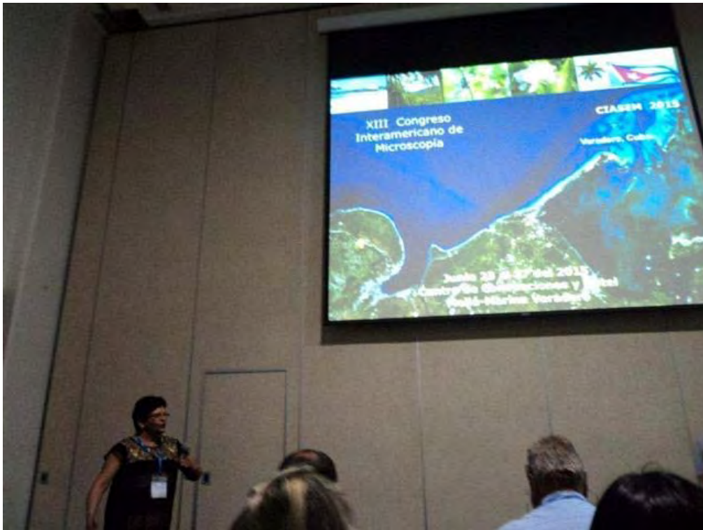
Presentación de la propaganda para solicitar la sede del CIASEM 2015