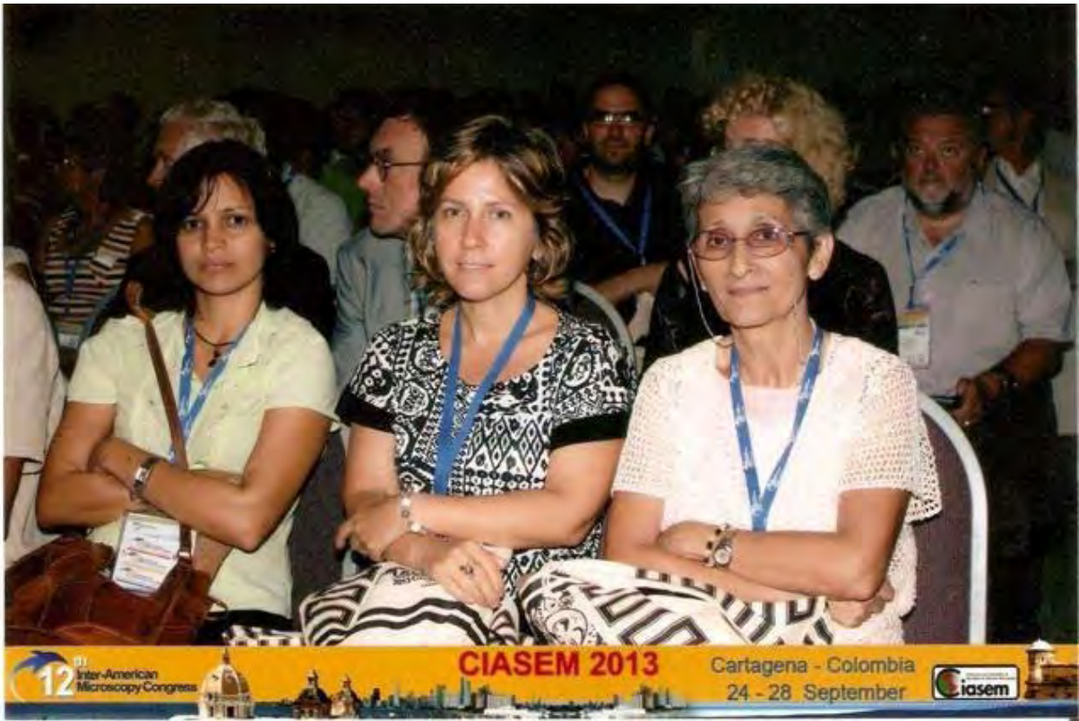
Momentos del Congreso