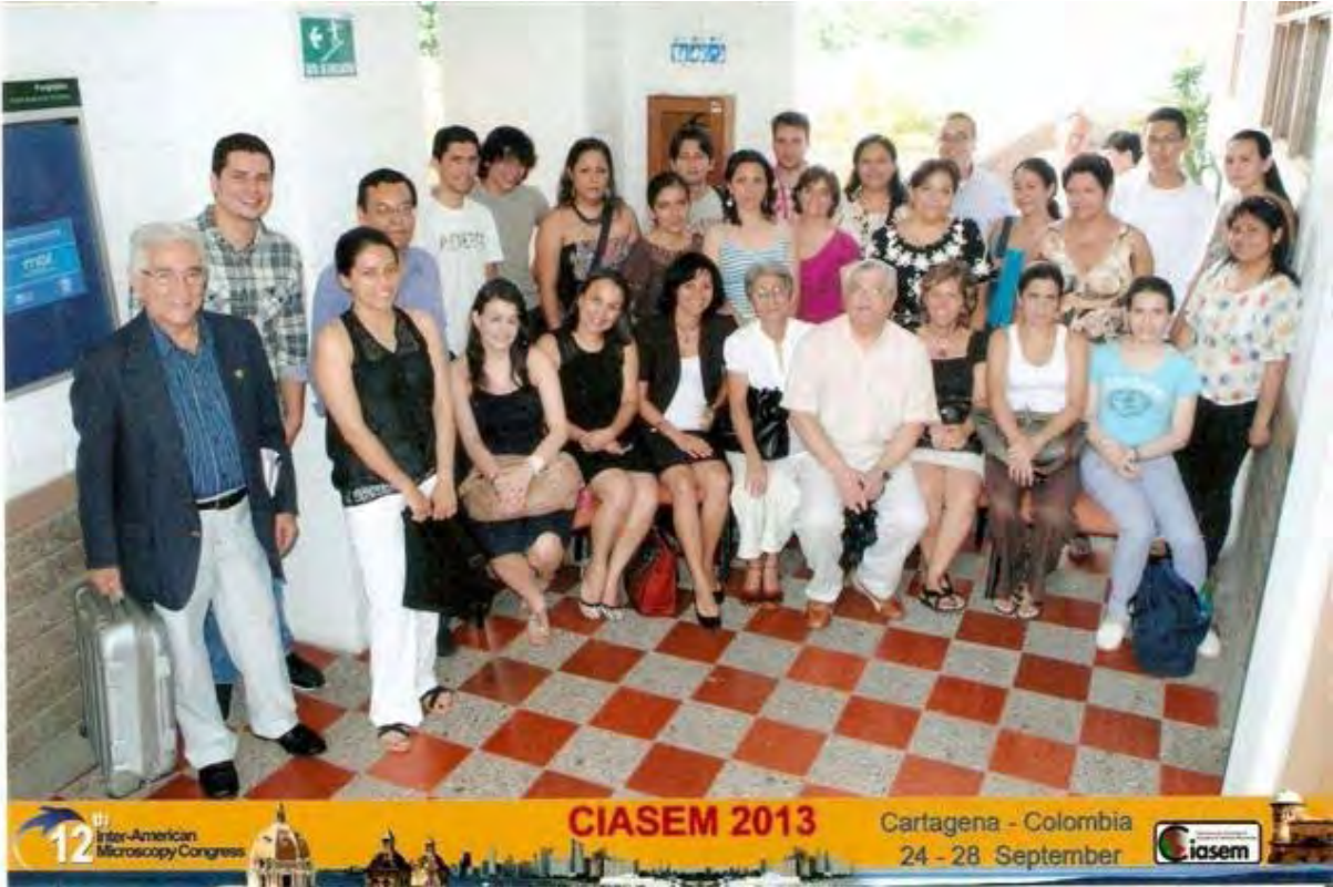
Participantes en los cursos precongreso.

Algunas imágenes del evento en Cartagena de Indias, Colombia.