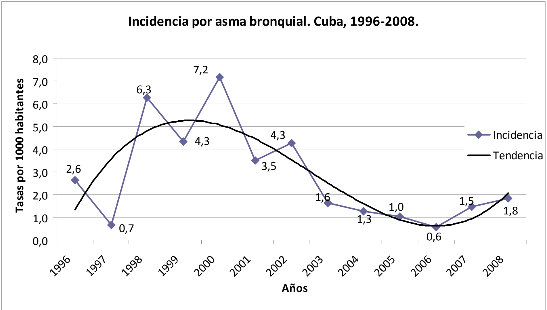
Incidencia por asma bronquial. Cuba, 1996-2008.